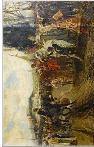
Francisco Padilla, La rendición de Granada