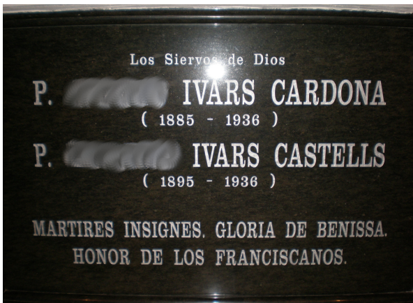
7. Pon los nombres de los dos mártires de Benissa enterrados aquí: