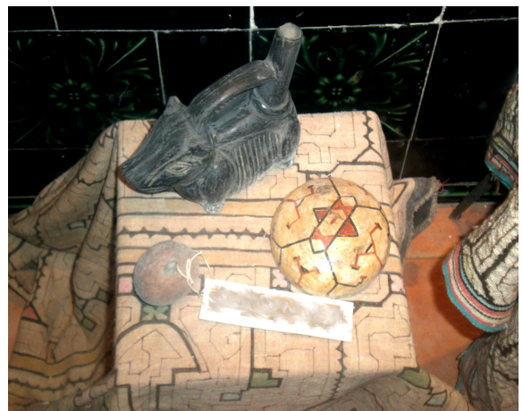
11. ¿De qué país es este objeto?