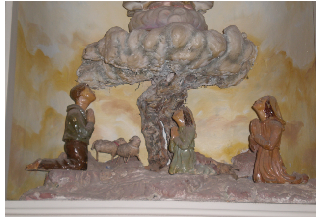
10. ¿En cuál de los 6 lugares está esta escultura?