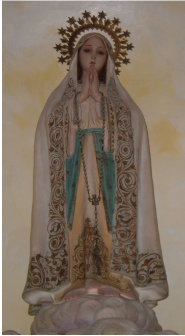
6. ¿Quién es?