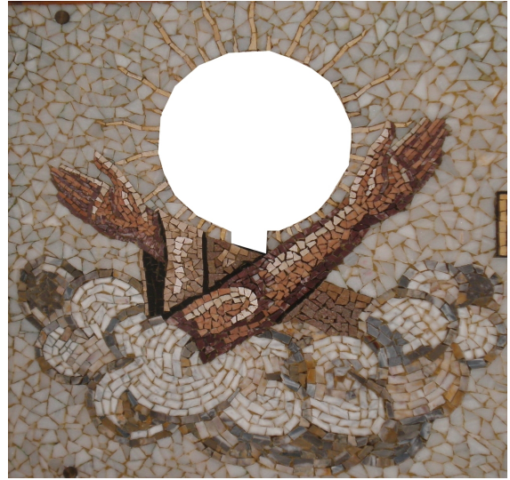
9. Dibuja el símbolo que falta