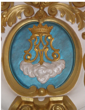
8. ¿En cuál de los 6 lugares se encuentra este relieve? _____